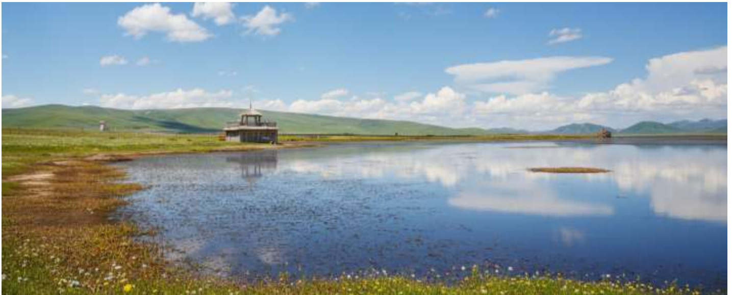
กลางวัน รับประทานอาหารกลางวัน ณ ภัตตาคาร (เมื่อที่ 17)

ขจี อากาศที่นี่บริสุทธิ์และบางเบา มีเพียงเสียงลมที่พัดผ่านยอดหญ้าและเสียงนกน้ำที่จับขานเป็นท่วงทำนองแห่งธรรมชาติ บรรยากาศอันเงียบสงบจะชะล้างความเหนื่อยล้าให้หมดสิ้นไปในทันที ทะเลสาบแห่งนี้ไม่ได้เป็นเพียงความงดงามทางสายตา แต่ยังเป็นพื้นที่ชุ่มน้ำอันอุดมสมบูรณ์และมีความสำคัญยิ่งต่อระบบนิเวศบนที่ราบสูงทิเบต ถือเป็นแหล่งพักพิงและสวรรค์ของเหล่ากอพยพนานาชนิด โดยเฉพาะอย่างยิ่ง "นกกระเรียนคอดำ" สัตว์ปีกสง่างามอันเป็นสัญลักษณ์แห่งความสุขและอายุยืนยาวในวัฒนธรรมทิเบต ในช่วงฤดูร้อนทุ่งหญ้ารอบทะเลสาบจะผลิดอกไม้ป่านานาพรรณ กลายเป็นภาพวาดสีสันสดใสที่ธรรมชาติรังสรรค์ขึ้น เชิญท่านทอดน่องไปตามสะพานไม้ที่ทอดยาวเหนือผืนน้ำ สูดอากาศอันแสนสดชื่นให้เต็มปอด พร้อมเก็บภาพความประทับใจของผืนน้ำจรดขอบฟ้า ที่ซึ่งฝูงปศุสัตว์ของชาวทิเบตพื้นเมืองกำลังเล็มหญ้าอย่างอิสระอยู่ไกลๆ