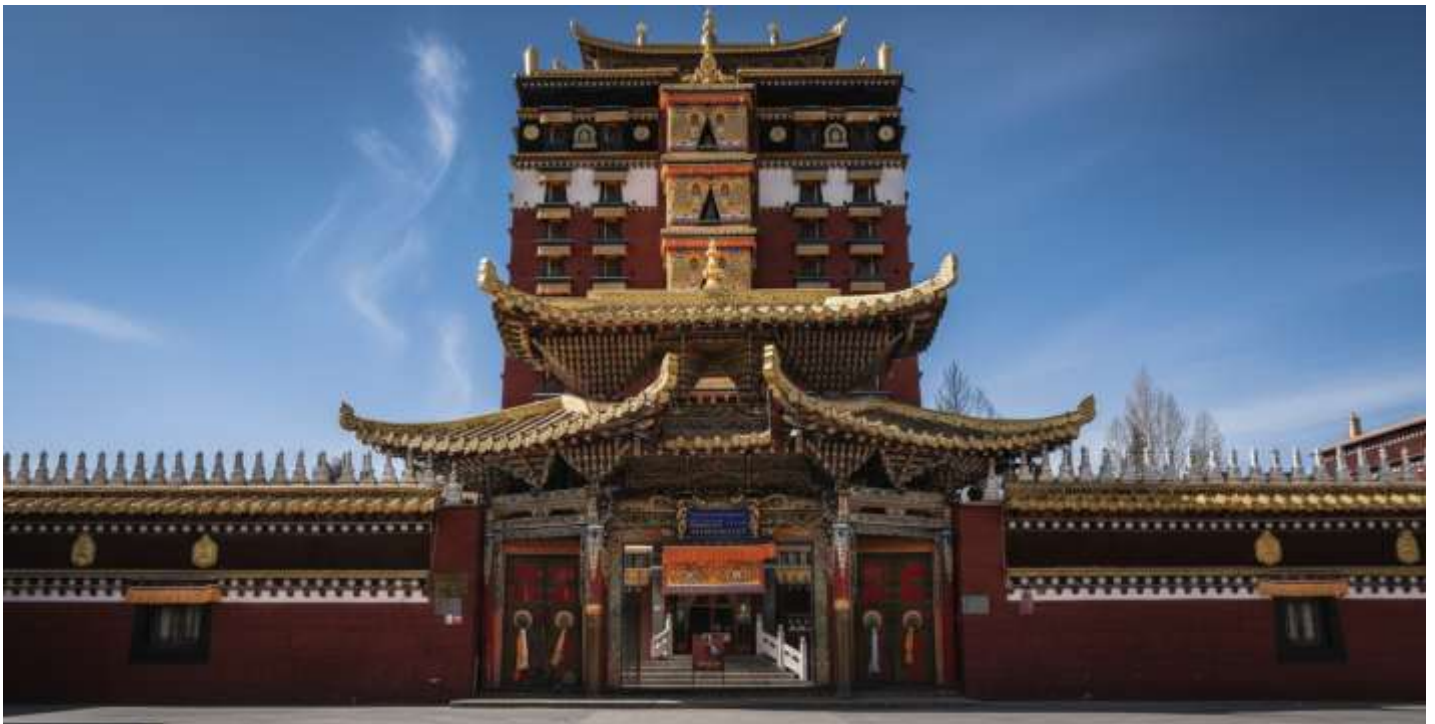
บ่าย นำท่านเดินทางสู่ หอพระมิลาเรปะ (ระยะทาง 134 ก.ม. ใช้เวลาเดินทางประมาณ 2 ชั่วโมง) สู่ใจกลางศรัทธา หอพระ 9 ชั้น มิลาเรปะ สถาปัตยกรรมทางพุทธศาสนาที่น่าอัศจรรย์ใจและเป็นหนึ่งเดียวใน